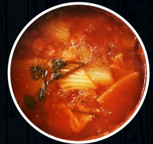
Kimchee Vị kim chi Hàn Quốc