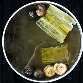
Dashi Vị nước hầm cá và rau củ