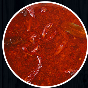
Sichuan spicy Vị cay Tứ Xuyên