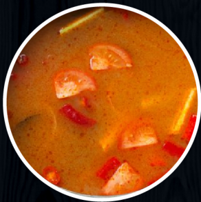
Vietnamese sweet & sour Vị chua ngọt Việt Nam