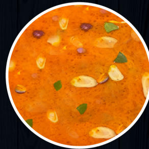
Tom Yum Vị chua cay kiểu Thái