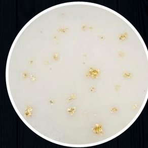
Tonyu Nabe Vị lẩu sữa